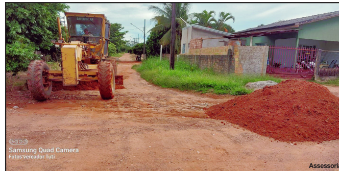
Recuperação de rua no bairro Jardim Renascer, em Alta Floresta

O bosque fica localizado no bairro Jardim Ipiranga, que fica anexo ao bairro Jardim Europa, e foi criado pela Prefeitura de Alta Floresta através de uma ação conjunta entre a Secretaria Municipal de Meio Ambiente e Desenvolvimento Sustentável, Secretaria Municipal de Saúde e Secretaria de Estado de Meio Ambiente (SEMA).