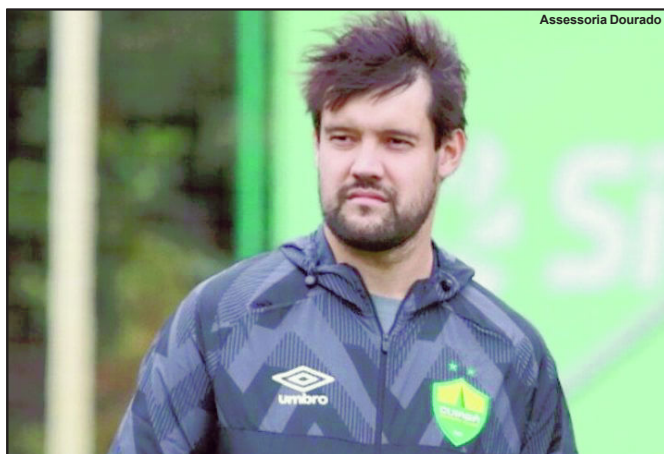
Iubel começará o ano frente do Cuiabá