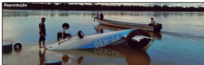
Avião caiu no Rio Teles Pires ao tentar pousar na pista de uma pousada