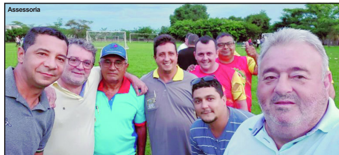
Decisão foi marcada pela presença de autoridades

LINDOMAR LEAL Assessoria de Imprensa Câmara Municipal