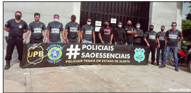
Servidores da Polícia Penal sofrem retaliações por realizarem greve em MT

plantonista da Comarca da Capital, que proceda ao imediato bloqueio das contas dos envolvidos, em valores correspondentes às multas diárias fixadas na decisão de Id. n. 113997497, a saber, R$ 200.000,00 (duzentos mil reais) por dia em relação ao SINDSPEN e R$ 50.000,00 (cinquenta mil reais) por dia em relação aos dirigentes da mencionada entidade, individualizados no documento de Id. n. 114014974, tendo por data-base o dia 23 de dezembro de 2021, quando o sindicato teve ciência inequívoca da determinação de retorno às atividades”, determina o desembargador.