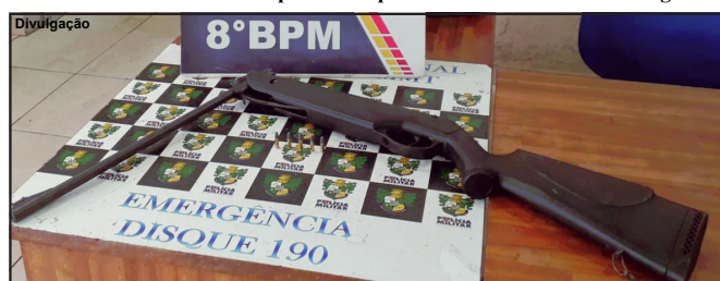
Espingarda de pressão adaptada para calibre 22 foi apreendida

Arma usada no crime foi apreendida pela PM e encaminhada à Delegacia