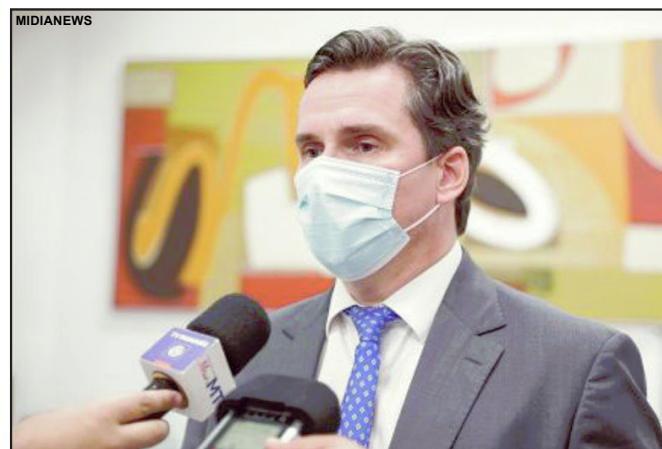
O secretário estadual de Fazenda Rogério Gallo

Esses atos criminosos têm sido amplamente combatidos pela Sefaz e