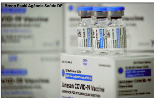
Vacina é aguardada para dose de reforço no município de Alta Floresta

Recentemente questionada sobre a situação a saúde municipal informou que aguarda o envio de doses pelo Governo do Estado, enquanto isso, a Secretaria de Estado de Saúde, por meio de nota enviada ao Notícia Exata, informa que conforme Resolução da Comissão Intergetores Bipartite (CIB) nº 126 de 2021, as novas doses das vacinas contra a Covid-19 passarão a ser distribuídas mediante solicitação das gestões municipais.