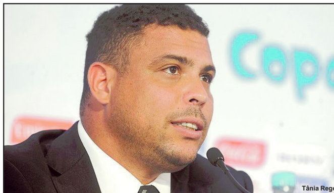
Ronaldo se tornou sócio majoritário do Cruzeiro