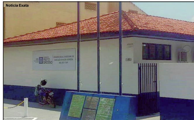
Indea alerta produtores sobre prazo de campanha

Instituto de Defesa Agropecuária faz alerta à região de Alta Floresta