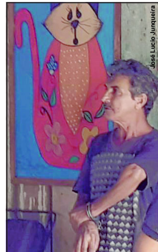
Assassino confessado diz que tinha a vítima como um irmão

A história contada pelo preso não convencia a polícia desde o primeiro momento. “É uma versão dele, mas vamos apurar e a Perícia deverá apontar o que de fato aconteceu”, comentou o investigador Luiz Cezar, que voltou ao local para buscar a arma do crime.