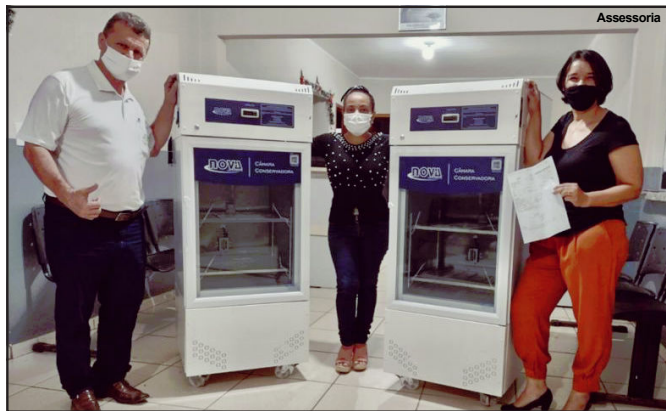
Alta Floresta também foi contemplada com ação da Federação