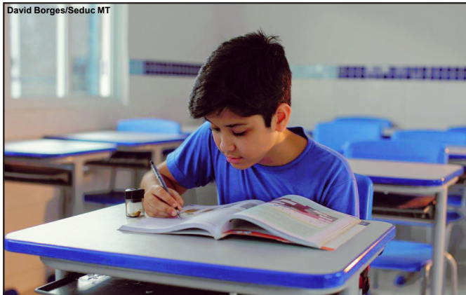
David Borges/Seduc MT

Prazo para fazer se encerra no dia 14 de janeiro, com atendimento presencial nas escolas das 8h às 18h; as aulas têm início no dia 7 de fevereiro