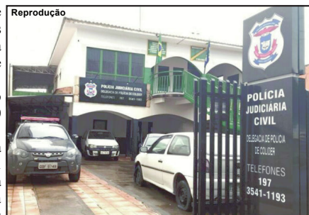
Autor do crime foi conduzido para a Delegacia de Polícia Civil em Colider

comentou que iria se entregar ao amanhecer do dia. Entretanto, quando os policiais anunciaram a prisão, ele tentou reagir e precisou ser contido, algemado e levado para a Delegacia.