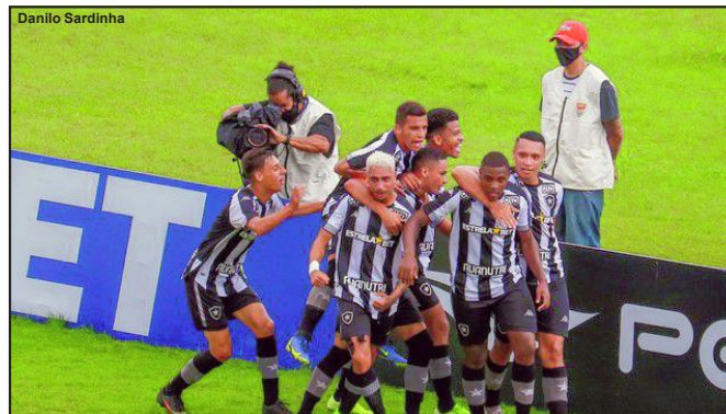
Botafogo estreia vencendo na Copinha