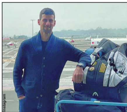
Djokovic está retido em hotel na Austrália