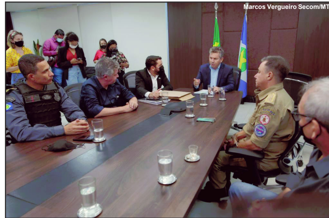
Mauro Mendes anunciando edital para concurso no setor de segurança

As provas vão ocorrer no dia 20 de fevereiro nos municípios de Cuiabá, Várzea Grande, Rondonópolis, Sinop e