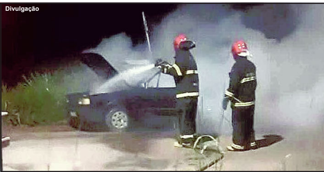
Militares foram acioados para atender caso na madrugada de domingo

Caso aconteceu na madrugada de domingo na Perimetral Rogério Silva