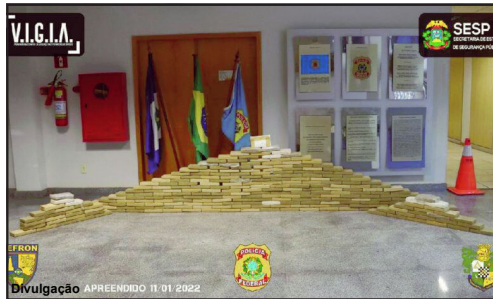
De acordo com a polícia, droga era do tráfico internacional

A prisão ocorreu em uma ação conjunta do Grupo Especial de Segurança de Fronteira (Gefron-MT), Polícia Federal (PF), 2ª Companhia Independente da Polícia Militar de Comodoro (CIPM) e o Núcleo da Polícia Militar de Campos de Júlio.