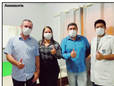
Prefeito e equipe sinalizam positivamente