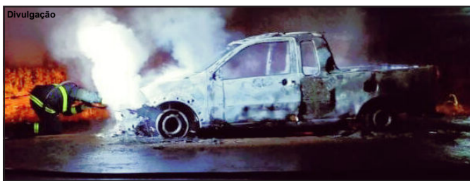
Corpo de Bombeiros atendeu caso, mas veículo foi totalmente destruído pelas chamas

Corpo de Bombeiros ainda foi acionado, mas não conseguiu evitar destruição total