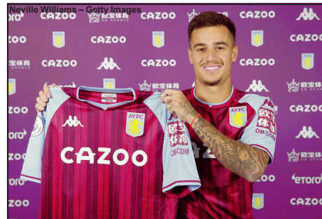
Coutinho está emprestado ao Aston Villa