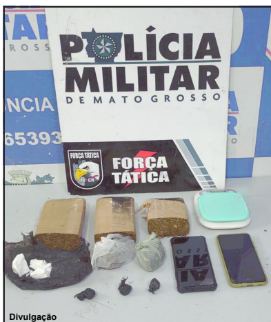
Droga apreendida com jovem é resultado de mais uma ação de cerco ao tráfico

Elemento de 19 anos foi preso em flagrante e levado para a Delegacia