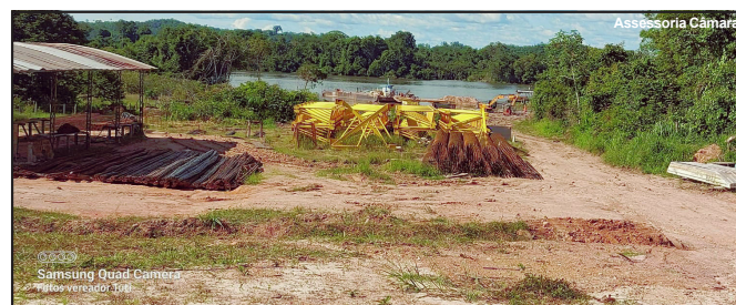
Ponte está sendo construída no Porto de Areia, Rio Teles Pires