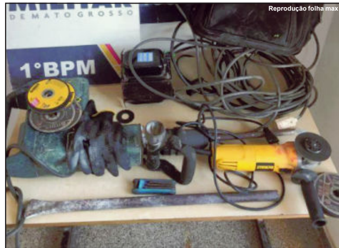
Reprodução folha max

Produtos apreendidos eram usados para arrombar comércio