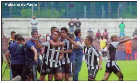
Botafogo eliminou o Resende