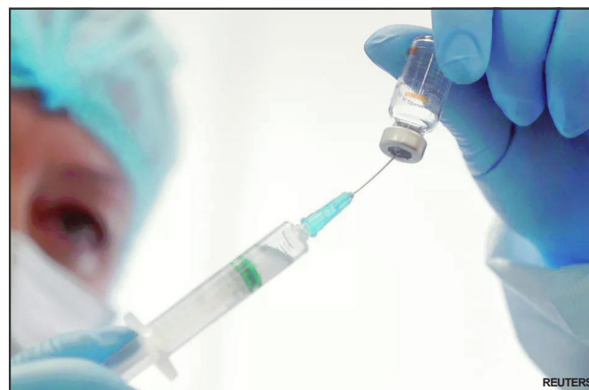
Vacinação contra COVID-19 torna-se obrigatória

A obrigatoriedade deve ser incluída nos regulamentos específicos de cada competição organizada pela CBF, que são publicados antes do início dos torneios.