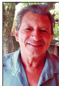
Trabalhador foi morto atropelado de moto na MT-208

apurar a responsabilidade do pai em relação ao filho sem ter autorização para dirigir estar em uma rodovia dirigindo um carro e que acabou matando uma pessoa. O caso é conduzido pela Delegacia de Paranaíta.