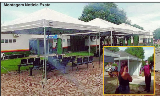
Policlínica foi onde o profissional da saúde fez desabafo

quintos dos infernos, a gente não vai conseguir dar um atendimento de