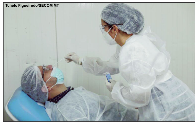
Exame do PCR são disponibilizados pelo governo de MT

“Essa é uma ação que vai subsidiar a testagem nos municípios e intensificar a detecção da Covid-19. Muitos municípios estão com poucos testes em suas Secretarias, portanto, essa remessa ajudará na identificação do vírus. É essencial detectarmos essa doença precocemente, e oferecer o acompanhamento médico desde