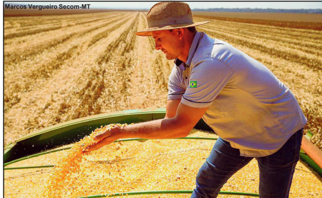
O estado se torna cada dia mais destaque na produção de grãos

Seis municípios despontam em produção agropecuária. São eles Sorriso, Sapezal, Campo Novo do Parecis,