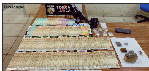
Força Tática recuperou dinheiro, apreendeu arma e droga

uma mulher de nome Raiane que acabou presa também, além de outro homem de 42 anos e mais um de 60 anos. Maconha e pasta base foram encontrados em posse dos suspeitos que acabaram encaminhados à Delegacia. O corpo de