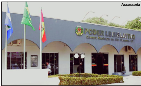
Câmara de Alta Floresta retoma expediente normal

LINDOMAR LEAL Assessoria de Imprensa Câmara Municipal