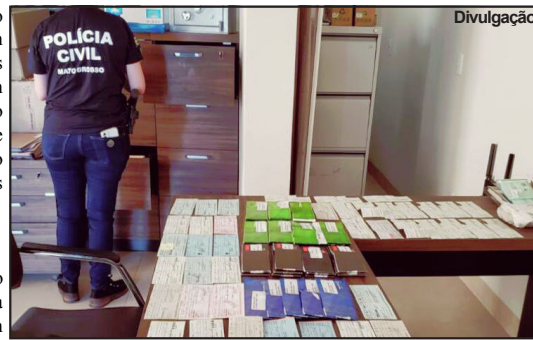
Mandados de busca cumpridos em muitas empresas

De acordo com a Sefaz, a empresa Agro Bom Sucesso Corretora de Cereais Ltda. iniciou suas atividades, supostamente, em 2018, no estado do