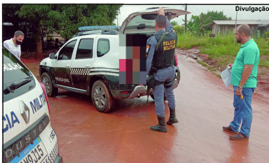
Menor apreendido pela PM em Carlinda tem várias passagens

Jovem de 17 anos foi detido em ação conjunta da Polícia Civil e PM