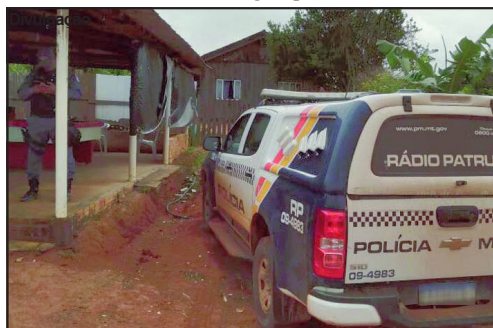
Caso atendido pela PM é apurado pela Polícia Civil

Homem de 38 anos fugiu após assassinar mulher dentro de casa