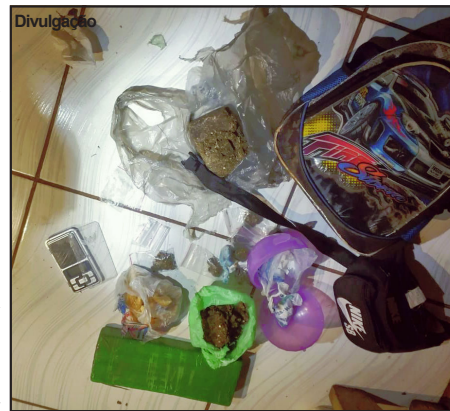
Muita droga apreendida na operação

viaturas e um batalhão de policiais civis, com o delegado diretamente à frente da ação contra o tráfico. O nome da operação é uma pronúncia francesa, dando referência à venda de produtos.