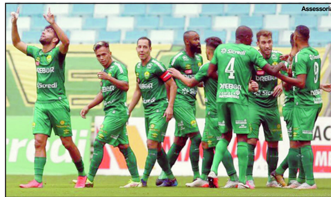
O dourado predominou e comemora mais um mato-grossense