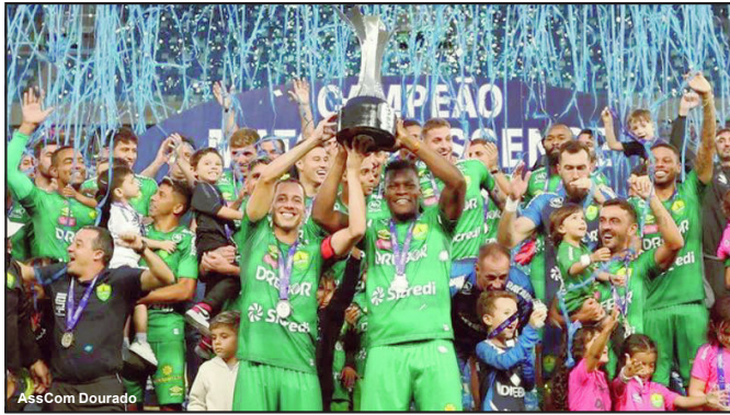
Cuiabá é bicampeão Mato-grossense