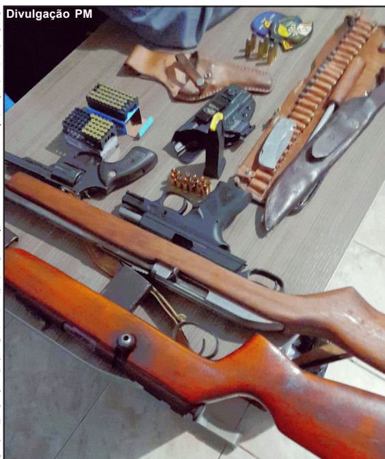
Armamento foi encaminhado à Delegacia de Terra Nova do Norte

O segundo caso um homem de 30 anos foi o preso, portando uma pistola 9 milímetros e dentro do carro que estava encontradas outras três armas,