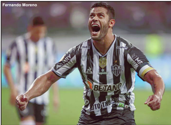
Hulk deu show em vitória do Galo

Outro resultado de destaque foi a vitória do São Paulo sobre o Athletico PR por 4x0 e com direito a hat-trick de Calleri. A goleada culminou na demissão do técnico Alberto Valentim do Furacão. Após o jogo, o comandante tricolor, Rogério Ceni comentou: "A derrota na final do Paulistão é uma ferida