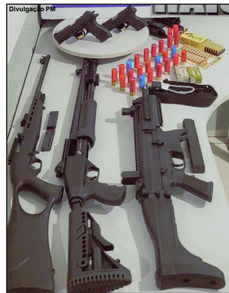
Arsenal apreendido com homem em Guarantã do Norte