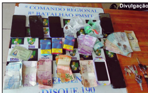
Produtos apreendidos pela PM na abordagem aos suspeitos

Alta Floresta/MT – Era pouco mais de seis horas da manhã de domingo quando a Polícia Militar de Alta Floresta foi informada de uma ‘festinha’ em um bar na Rodovia MT-208, sentido Carlinda e que no local havia pessoas traficando droga. Uma equipe de militares foi ao local e chegando lá