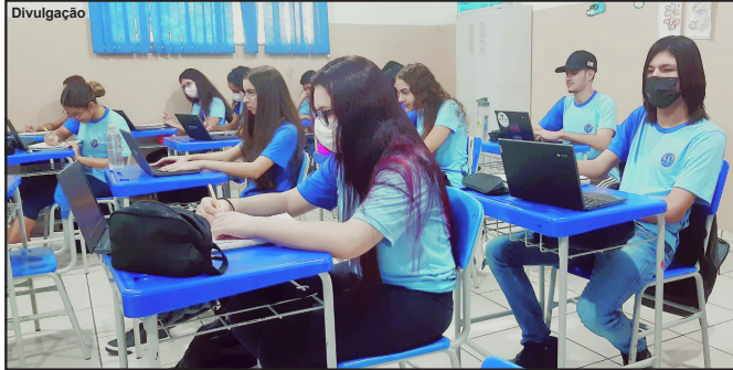
Alunos da Unidade de Ensino ganharão qualificação ainda maior