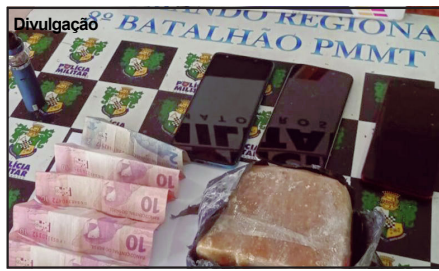
Pasta base de cocaína estava em mochila de infrator apreendido pela PM

Um dos indivíduos tentou inclusive entrar em micro-ônibus que para sempre em frente ao hotel com moradores do município de Apicacás. Mas os policiais fizeram a busca