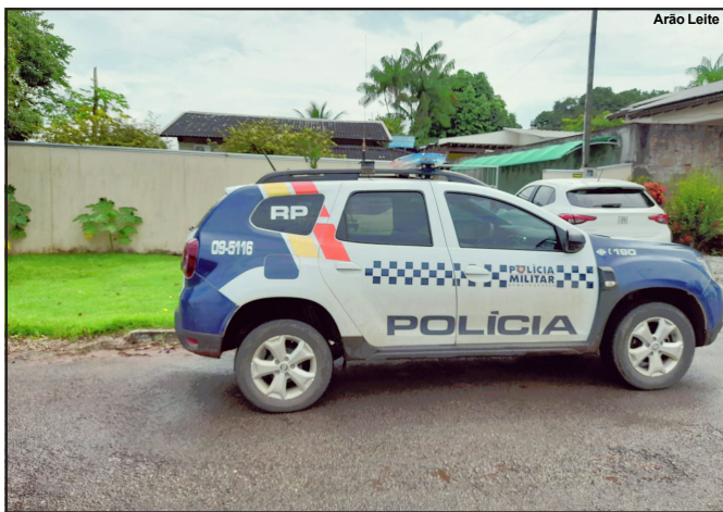
Polícia Militar foi acionada, mas ladrão conseguiu fugir antes

Filho do proprietário do imóvel quase flagrou ladrão dentro da residência