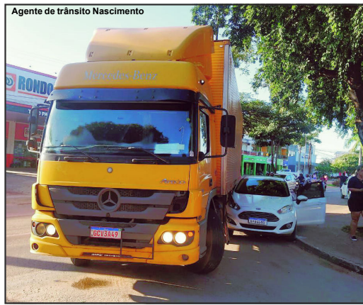
Caminhão transitando na avenida fecha carro e provoca acidente

no Fiesta e provocou danos de média monta disse que não tinha conhecimento da Lei. Mas os agentes informaram que em vários pontos estratégicos da cidade, principalmente entrada e pontos referências nas avenidas centrais tem a sinalização vertical advertindo sobre a proibição.