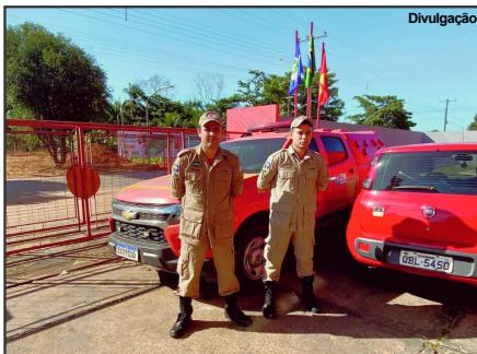
Ação do Corpo de Bombeiros em Alta Floresta

Durante os dias da OPERAÇÃO ALVARÁ LEGAL III, a 7ª CIBM realizará fiscalizações nos estabelecimentos de Alta Floresta - MT buscando orientar a população quanto às medidas de segurança contra incêndio e pânico necessárias para estes locais, de modo a garantir a proteção das pessoas e prevenção de incêndios, sendo primordial vistorias inopinadas para verificar a efetividade da Lei e a segurança dos referidos empreendimentos.