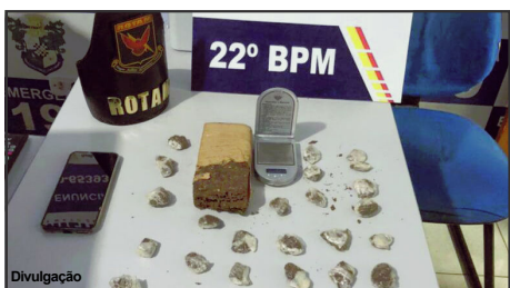
Maconha retirada das ruas pela PM de Peixoto