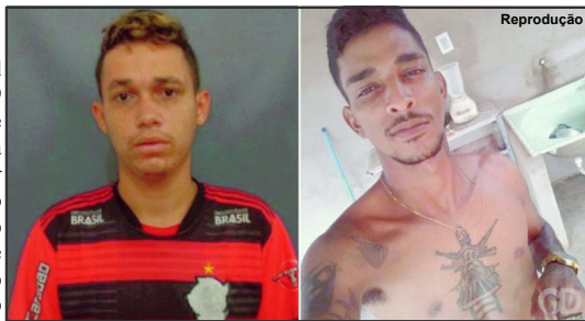
Elementos são procurados pela Polícia Civil de MT

A Polícia Civil de Brasnorte (579 km ao Noroeste de Cuiabá) está procurando por dois membros do Comando Vermelho que participaram do homicídio qualificado que vitimou a jovem