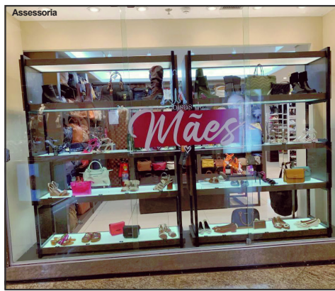
Órgão de defesa do consumidor faz orientações em MT

Compras pela internet: antes de efetuar a compra, pesquise se a loja é confiável e se existem muitas reclamações sobre ela. Confira no site o número do Cadastro Nacional de Pessoa Jurídica (CNPJ), endereço físico e canais de troca e atendimento. Observe, também, se há cobrança de frete, existência de outras