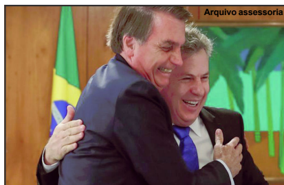
Mauro Mendes e Bolsonaro devem fazer dobradinha em Mato Grosso