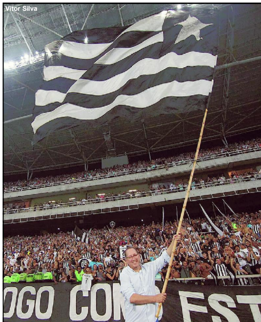
John Textor comemora com a torcida do Botafogo