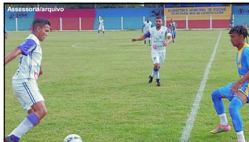
Mixto levou a melhor e se tornou líder isolado