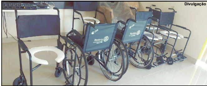
Programa atende centenas de pedidos todo ano rotário

Município de Alta Floresta é sempre destaque nas ações do clube de serviço pela ação social