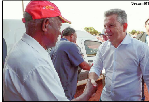
Mauro Mendes visita vários municípios da região

Além disso, serão assinados convênios em prol da infraestrutura do município, visando a construção de ponte de concreto sobre o Rio Paranaíta (90,6m) e para asfalto novo e drenagem na Rua 608, setor