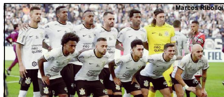
Corinthians segue líder do Brasileirão