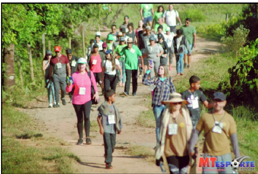
Evento foi na manhã de domingo em Alta Floresta

Evento reuniu centenas de famílias no Circuito Derney Del Moro em AF