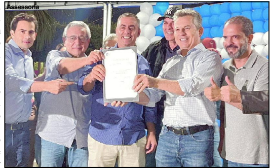
Momento foi de anunciar investimentos

declara que o dia 19 de maio passa a ser um momento histórico para Município, através da assinatura do Convênio para a Pavimentação Asfáltica da MT 206. O Prefeito ainda destaca que o governador Mauro Mendes tem contribuído e