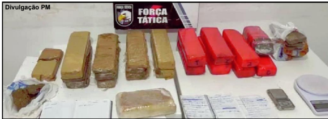
Força Tática da PM atuou arduamente nas ações apreendendo muita droga

Cinco pessoas foram presas e cadernos do tráfico entregues à Polícia Civil