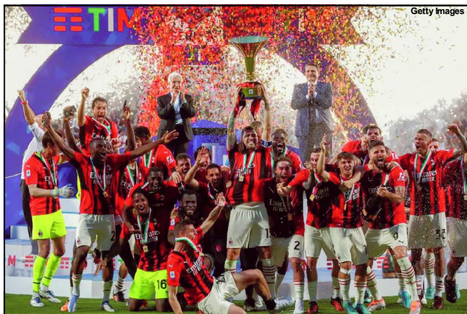
Milan é campeão italiano pela 19ª vez