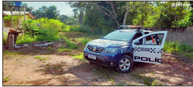
Polícia fez cerco na mata em busca de ladrões em AF

Mas os bandidos que queriam dinheiro e objeto de valor, levaram entre os pertences, uma pistola calibre 380. Diligências foram feitas dentro da mata no setor de chácaras entre a Rua T4 e bairro Operário. Policiais entraram em várias propriedades e fizeram uma varredura. Mas os bandidos conseguiram sair do local. Um no entanto foi visto saindo dos da Associação de Moradores