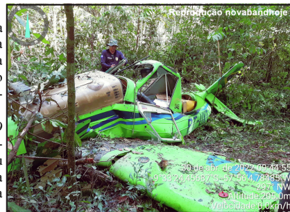
Acidente ocorreu no final de semana no extremo norte do estado