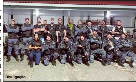
Ação conjunta da Polícia Civil e PM pegou jovens de surpresa em festa clandestina