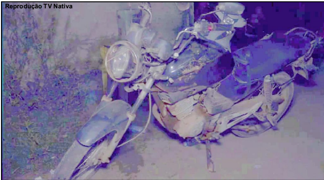
Moto de homem atropelado por carro ficou danificada

Vítima de 54 anos foi levado pelo Corpo de Bombeiros ao Hospital Regional