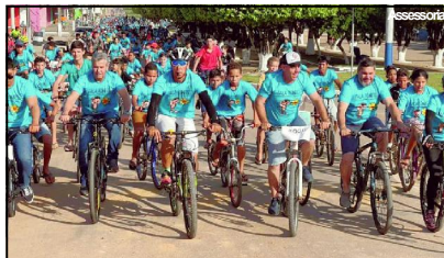
Evento é um dos maiores do estado