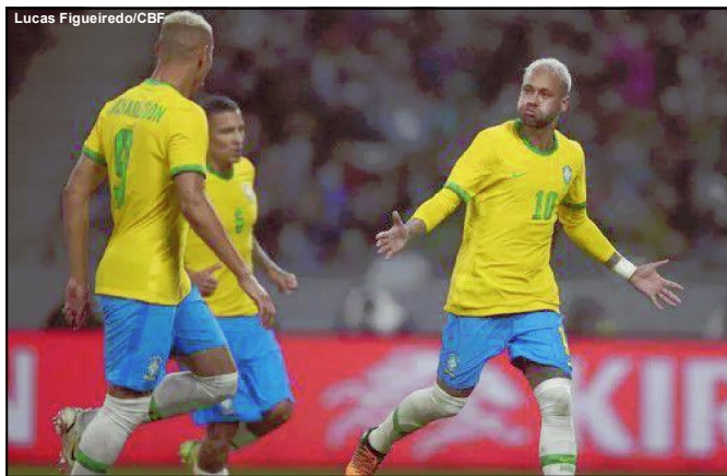
Neymar comemora gol da vitória frente ao Japão