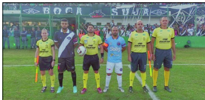
Mixto está na Série A do Mato-Grossense em 2023