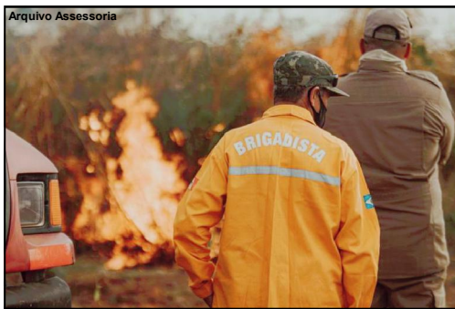
Brigada municipal será novamente formada em AF