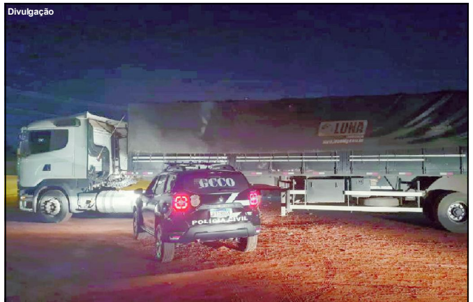
Carga havia sido roubada na sexta-feira e foi interceptada