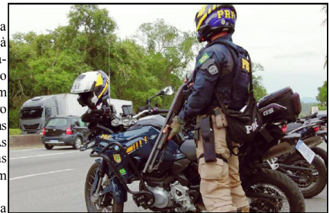
Intensificação de ações fiscalizatórias serão durante feriado prolongado

“Durante a operação, a PRF fará o direcionamento planejado para reforçar a fiscalização em trechos estratégicos das