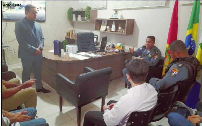
Reunião sobre setor de segurança no município de Alta Floresta

A ação faz parte do Projeto Vigiai + MT que atenderá todo o estado de Mato Grosso