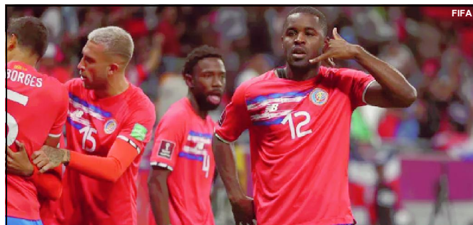
Campbell comemora gol da Costa Rica

A Austrália ingressará o Grupo D juntamente com a atual campeã mundial França, Dinamarca e Tunísia. Já a Costa Rica entra no que se pode dizer que é o "grupo da morte" desta edição: Alemanha, Espanha e Japão.