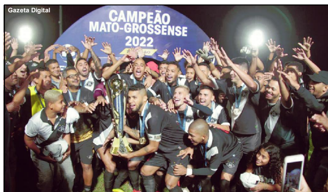
Mixto é campeão da Série B do Mato Grossense