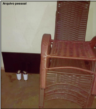
Pertences da vítima recuperados na casa do ladrão

Operador de máquina recuperou pertences e o suspeito desapareceu