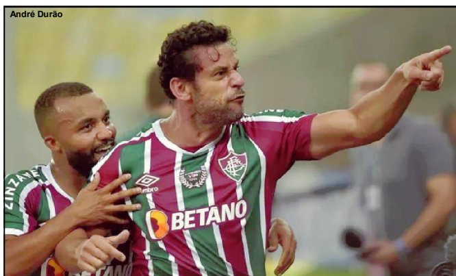
Fluminense de Fred decide vaga contra o Cruzeiro