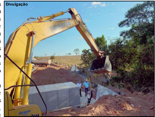
Obra executada na zona rural de Alta Floresta foi visitada pelo prefeito na segunda-feira

que nós acompanhamos de perto executada com recursos públicos para a comunidade, parabéns ao