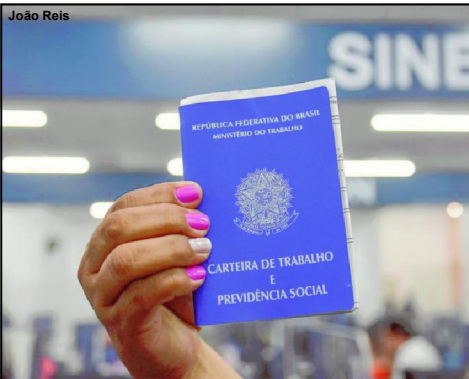
Cidades como Alta Floresta no Mato Grosso têm muitas vagas de empregos todos os dias