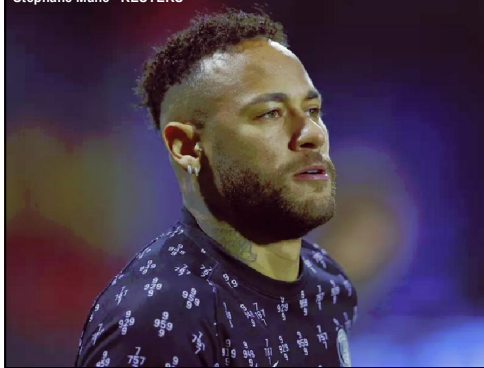
Neymar Jr será julgado em Barcelona