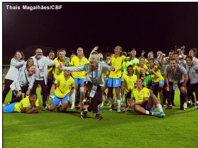
Seleção Brasileira está na final da Copa América

Com a vitória sobre o Paraguai, o Brasil garantiu vaga na final da Copa América contra a seleção anfitriã, a Colômbia, o jogo do título será neste sábado (30) no estádio Alfonso López às 20:00 horas. A Seleção Brasileira também está classificada para a Copa do Mundo Feminina de 2023 que será disputada na Austrália e Nova Zelândia e também para as Olimpíadas de Paris 2024.