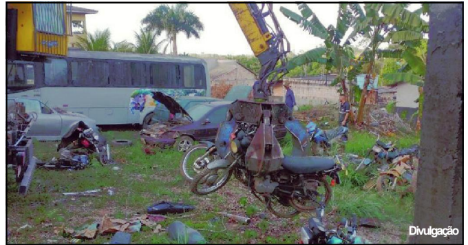
Veículos estavam no pátio do Departamento de Trânsito há anos

essa foi uma ação conjunta entre Departamento de Trânsito de Mato Grosso através da 20ª Ciretran com o Departamento de Trânsito (Prefeitura de Alta Floresta).