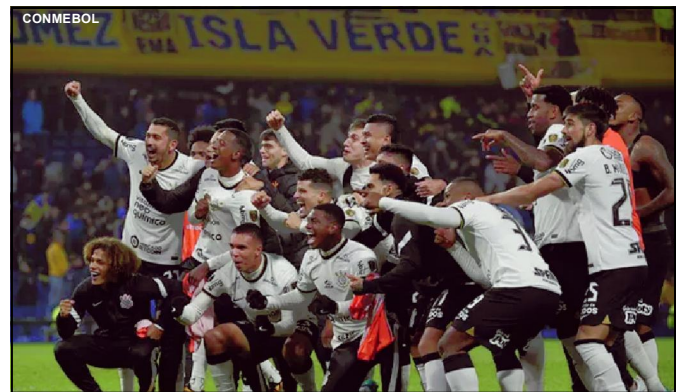
Corinthians elimina o Boca em La Bambonera