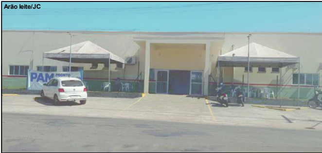
Jovem que deu à luz foi acolhida primeiramente no Pronto Atendimento

Secretaria de Assistência Social acolheu bebê e monitora a família