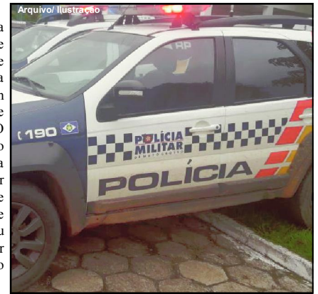
Polícia Militar foi acionada no caso

no início da semana até a casa onde a menor estava, pegaram todos os pertences dela e, com um carro da prefeitura de Alta Floresta, se deslocavam para Apicás. “Mas enquanto motorista estava no posto pagando o abastecimento, ela fugiu de novo e voltou para ele. Ela diz que ama ele, mas a relação deles não dá certo e quero muito levar minha filha de volta”, disse a mãe que fez um apelo pela TV para ter a filha de volta.