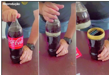
Policial penal mostra o mecanismo para se esconder os aparelhos

Esquema foi descoberto na última semana, durante operação das polícias civil e penal