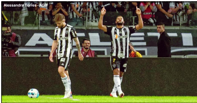
Hulk comemora gol no Mineirão