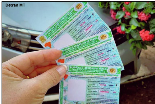
Regularização do documento é obrigatória

Para renovar a habilitação, o motorista pode baixar o aplicativo MT Cidadão ou acessar o site oficial do Detran