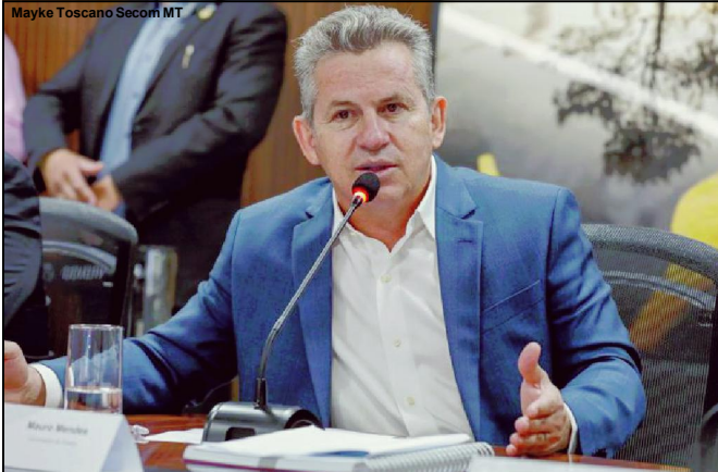
Governador deixará palanque aberto no apoio ao Senado

Governador vai fazer nova rodada de conversas com líderes para discutir apoio ao Senado