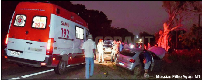
Acidente aconteceu próximo de Rondonópolis