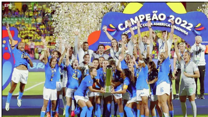
Brasil é octacampeão da Copa América feminina