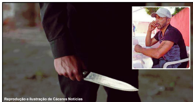
Reprodução e ilustração de Cáceres Notícias

Crime aconteceu em Pontes e Lacerda onde dois homens forma presos logo após ocorrido