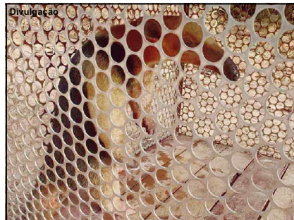
Animal resgatado foi devolvido à natureza

O animal foi capturado com a ajuda de um cabão e posteriormente solto em seu habitat natural.