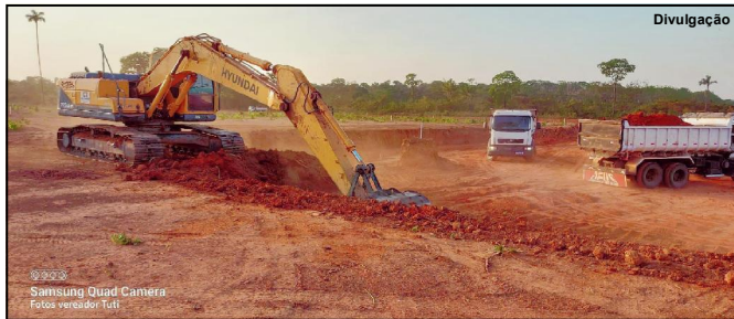
Execução de obra a todo vapor no município de Alta Floresta