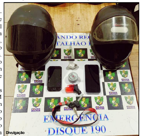
Droga e celulares apreendidos na ação policial

flagrou os suspeitos tentando fugir. Mas a viatura saiu atrás e conseguiu alcançar a motocicleta e pegar os suspeitos. “Mas antes da abordagem um deles descartou um objeto”, comentou a PM que ao checar o produto, constatou que era entorpecente.