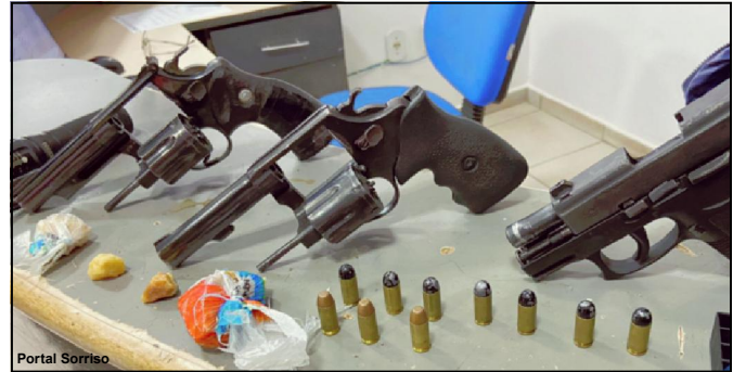
Armas e drogas foram apreendidas pela Polícia

Conselho tutelar foi acionado e ficou responsável pela pequena, além dos outros 3 filhos do casal. Já a esposa foi encaminhada para uma unidade médica para tratar o corte profundo na mão. Agressor foi levado para a delegacia, onde o caso foi registrado. Ele foi autuado por tentativa de feminicídio e sequestro e cárcere privado.