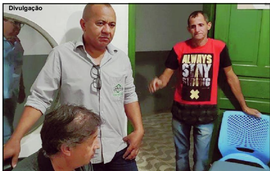
Ato aconteceu no Complexo Esportivo Municipal de AF