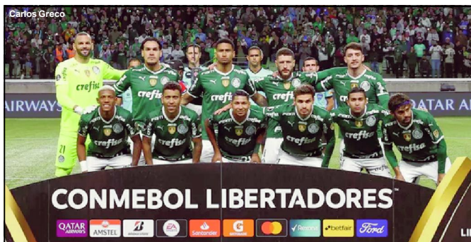
Palmeiras vai em busca do tetra da Libertadores