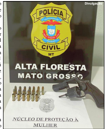
Revólver apreendido era do suspeito preso

O suspeito foi preso e se encontra à disposição da Justiça.