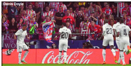
Rodrygo marcou o gol da vitória do Real Madrid frente ao Atlético