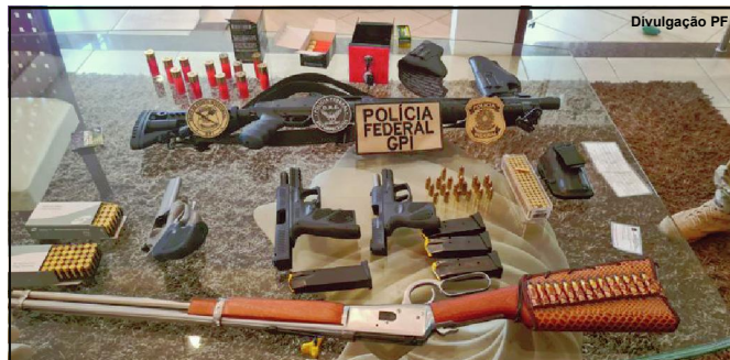
Armamento foi apreendido na ação da Polícia Federal quinta-feira

Os policiais cumpriram 23 (vinte e três) mandados de busca e apreensão, 9 (nove) mandados de prisão preventiva, além do sequestro de diversos bens nas cidades de Cuiabá-MT, Várzea Grande-MT, Cáceres-MT, Alta Floresta-MT, Mirassol D'Oeste-MT, Pontes e