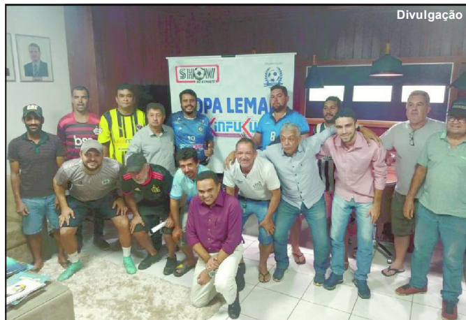
Dirigentes de Equipes e Lemaf após definição de como será disputa da Copa Lemaf 2022

Dez times foram inscritos na competição que vai dar dez mil reais aos melhores