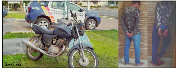
Moto foi descaracterizada por ladrões em AF

suspeitos de assaltos no município e ainda, estavam com uma moto que foi roubada na noite de segunda-feira. O veículo Honda 2008, que era da cor vermelha, já tinha sido descaracterizado. Estava sem placa e a cor agora era preta.