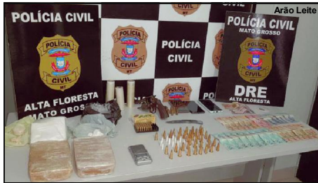
Muita droga e carro 'tunado', além de arma foram apreendidos em ação da PC

Jovem de 24 anos segundo investigação, é ligado à líder de facção