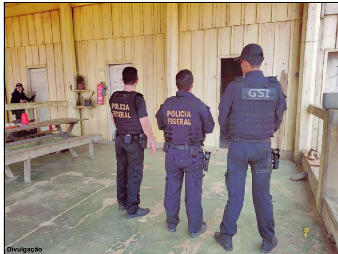
Ação conjunta constatou trabalho análogo à escravo em propriedade rural

Durante a inspeção, foi verificado que não eram mantidas condições de conservação, limpeza e higiene no alojamento. Entrevistados, os trabalhadores relataram