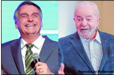
Os candidatos Jair Bolsonaro e Luiz Inácio Lula da Silva, que polarizam a campanha

Jair Bolsonaro subiu 10 pontos em relação ao levantamento anterior e Lula recuou 7 pontos