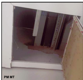
Ação criminosa aconteceu durante a madrugada, mas foi frustrada