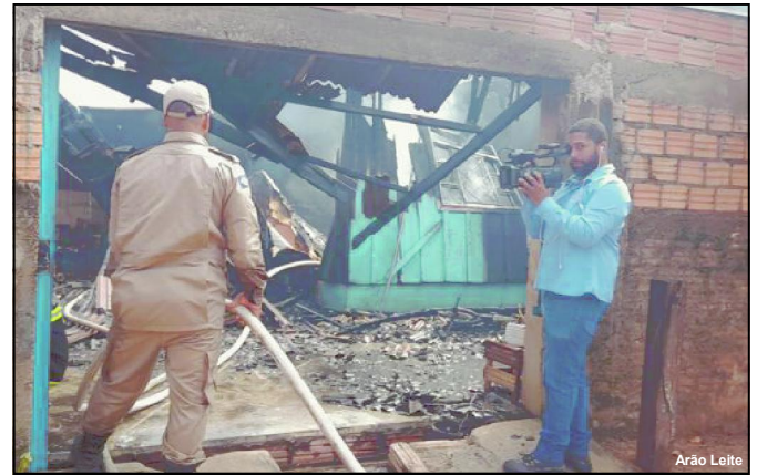
Fogo acabou controlado rapidamente, mas a destruição foi inevitável