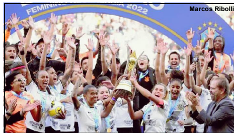
As Brabas celebram o tricampeonato brasileiro