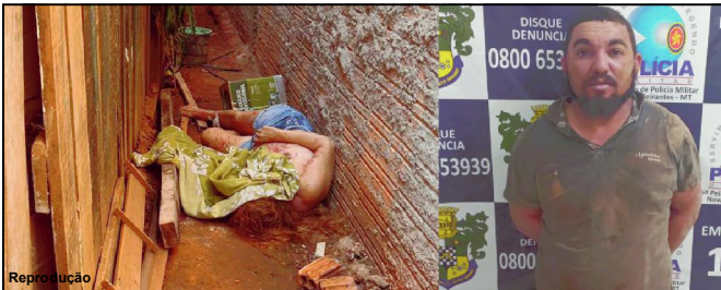
Vítima tentou se esconder do assassino, mas foi cercada e morta em um corredor