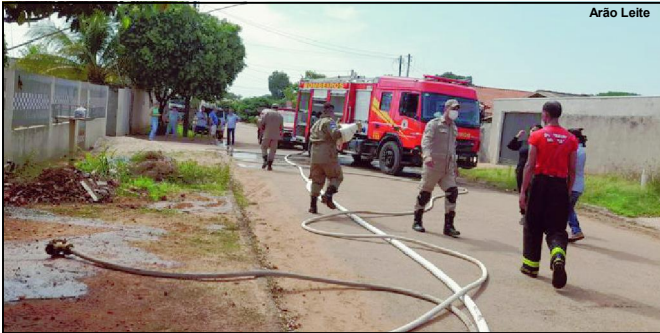
Bombeiros precisaram agir rapidamente para fogo não se alastrar

Incêndio teria iniciado no quarto onde estava criança de 5 anos