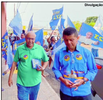
Candidato tem apresentado suas propostas e escutado população