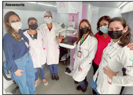
Outubro é mês de conscientização