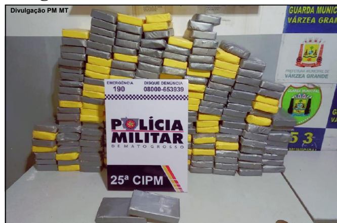
Material foi apreendido domingo quando militares estavam em patrulhamento