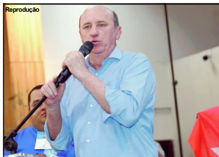
Deputado federal ainda tentar reverter situação

A defesa ainda pediu o recurso fosse analisado, mesmo o TSE ainda não ter publicado na íntegra o acórdão da decisão dessa quinta-feira (29). “A juntada do acórdão provisório e do vídeo do julgamento se justifica pela impossibilidade de se aguardar a disponibilização do acórdão consolidado. Isso porque, conforme será propriamente demonstrado adiante, faz-se