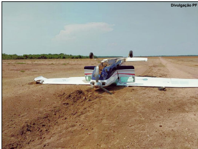
Avião que transportou a droga foi apreendido

Assessoria integrada com Gefron, a Força Aérea Brasileira (FAB), realizou sábado, 01/10, A Polícia Federal, em operação