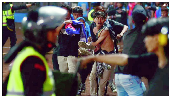
Confusão em jogo da Liga 1 na Indonésia

Com o lamentável episódio, a liga nacional da Indonésia suspendeu as