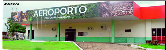
Aeroporto Municipal de Alta Floresta