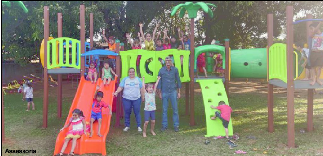
Prefeito e secretária de educação em momento de alegria da criançada

Prefeitura de Alta Floresta está investindo mais de R$ 1 milhão na aquisição de parques infantis e vai contemplar 18 escolas da rede municipal.