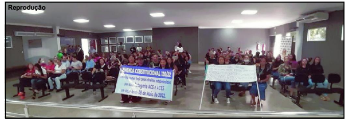
Emenda Constitucional garante repasse aos servidores da saúde