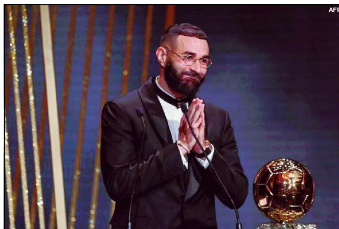
Benzema conquista a Bola de Ouro 2022