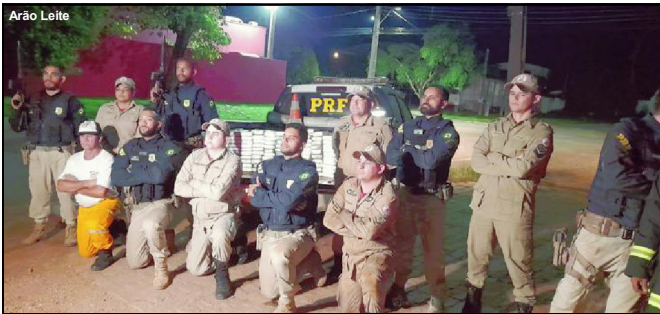
Registro dos agentes da PRF com bombeiros e brigada após retirada da droga de caminhão em AF

Delegado do caso informou que motorista preso preferiu ficar calado