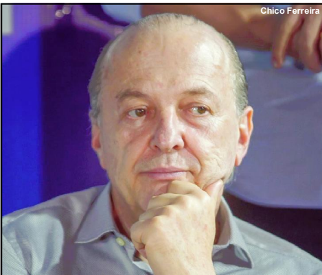
Vice-governador de Mato Grosso, Otaviano Pivetta

Vice-governador reeleito, Otaviano Pivetta descartou qualquer tratativa para lotear as secretarias do Palácio Paiaguás aos partidos e aliados políticos que apoiaram a chapa de reeleição do governador Mauro Mendes (União). Nem mesmo o Republicanos, partido que abriga o próprio gestor, deve ser contemplado.