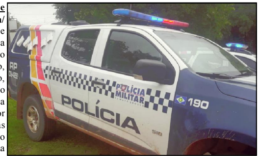
Polícia Militar fez diligências, mas não encontrou ladrões

O motoqueiro de 27 anos, que estava com uma mochila nas costas teria ficado estático na motocicleta, segurando as mãos no guidão, mas teve que soltar depois de levar socos, pontapés e ver que um dos bandidos sacou uma arma que tinha na cintura. “Pensei que era brincadeira de alguém”, teria dito a vítima ao acrescentar que os dois elementos são de estatura mediana e jovens.