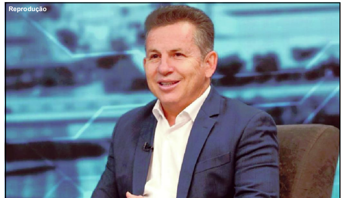
Governador faz apelo para correligionários conquistar votos

Para o governador, resultado será acirrado do segundo turno presidencial, com pequena margem