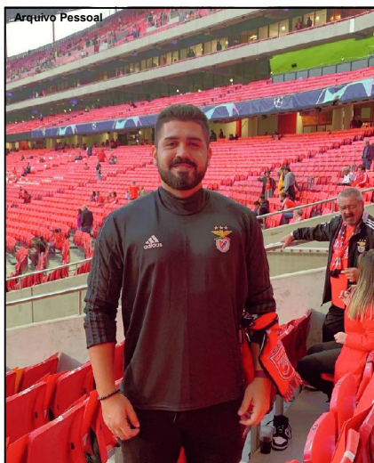
"Gustavo Sampaio": Jornal da Cidade no Estádio da Luz

O Jornal da Cidade se fez presente no Estádio da Luz para acompanhar o clássico europeu entre Benfica e