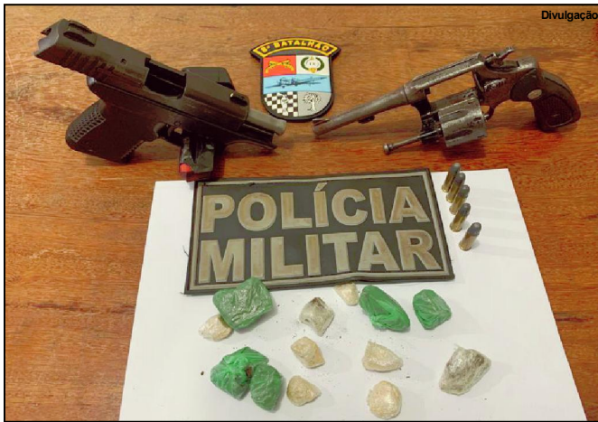
Armas e droga apreendidas em Nova Bandeirantes

Organização criminosa pode estar envolvida em crime contra morador