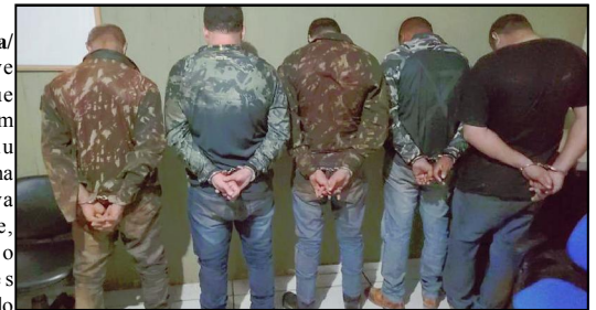
Suspeitos estavam em duas caminhonetes, tentaram fugir, mas foram presos

Alta Floresta/MT – Os nove homens que integravam um bando que agiu criminosamente na região de Nova Monte Verde, invadindo propriedades rurais, ameaçando produtores, extorquindo e ainda