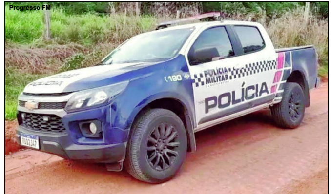
Viaturas da PM rondam a região onde aconteceu ataque essa semana