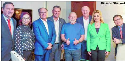
Lideranças de Mato Grosso com o presidente eleito Luiz Inácio Lula da Silva e o vice eleito Geraldo Alckmin em 30 de outubro.