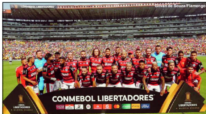
Flamengo é tricampeão da Libertadores

Longe das atuações beirando ao brilhantismo e demonstrando até um