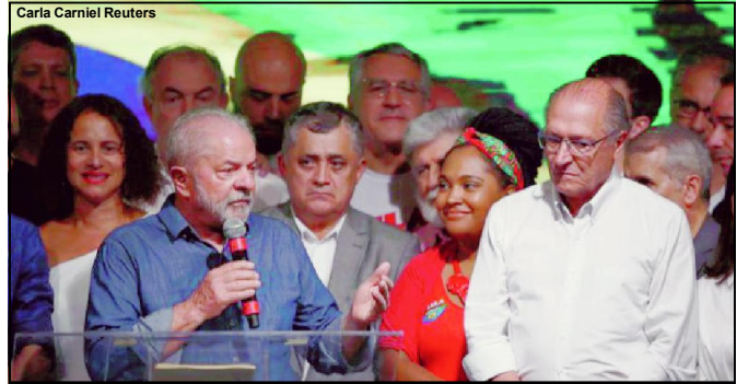
Luiz Inácio Lula da Silva discursando, ao lado do vice-presidente eleito, Geraldo Alckmin, após a vitória nas eleições.