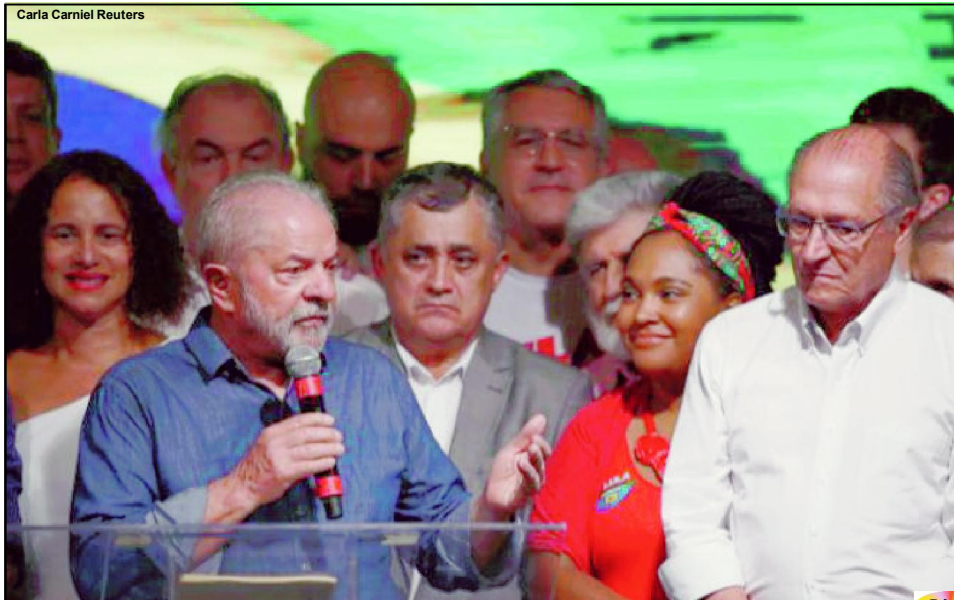
Carla Carniel Reuters