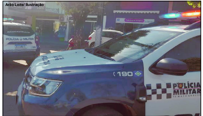
PM atuou firme na segurança durante final de semana de eleições