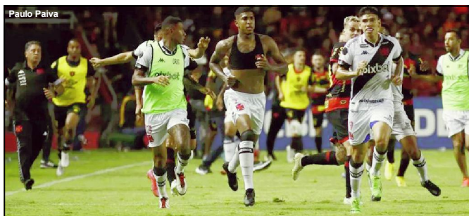
Jogadores do Vasco fogem da invasão em jogo contra o Sport