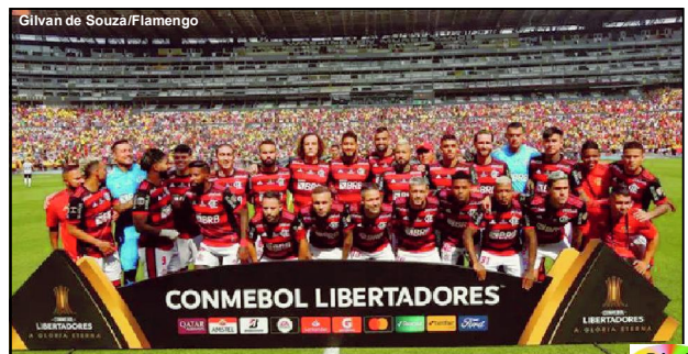
Gilvan de Souza/Flamengo