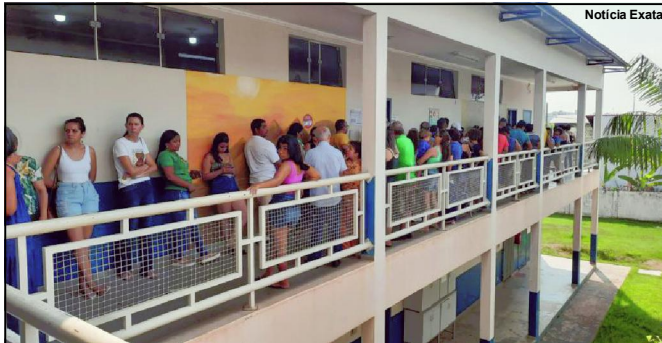
Um dos pontos de votação em Alta Floresta

O candidato eleito, Luiz Inácio ficou com pouco mais de 28%