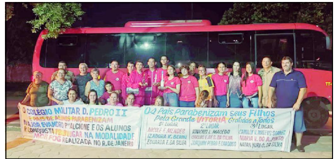
Delegação é recebida pelos pais dos alunos e comemora em AF

Além de preencher dados e dar o motivo para ter faltado à votação, é aconselhável anexar documentos que comprovem a justificativa, que em todo caso deve ser analisada por um juiz eleitoral, que pode aceitá-la ou não.