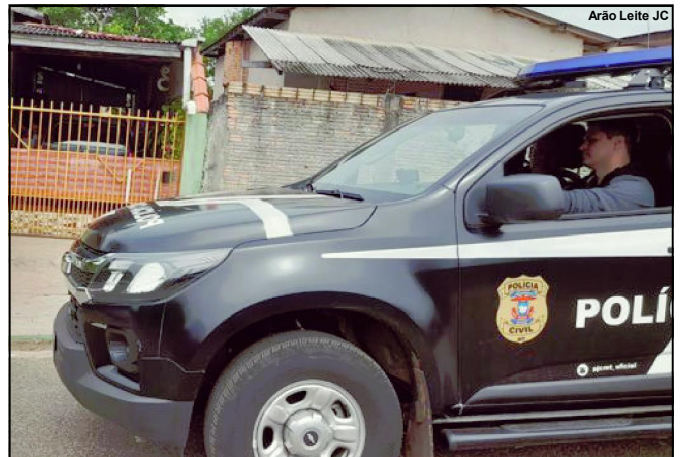
Polícia Civil esteve coletando material no cenário do crime

De acordo com o que passou à Polícia, a vítima ao abrir a porta da residência, percebeu um carro preto na frente, do outro lado da rua. “Mas logo que observou que o veículo saiu e em seguida chegou uma moto. Foi quando uma pessoa desceu, perguntou se ele era o Paraná e ao receber a resposta positiva começaram os disparos”, informou sargento PM Xavier,