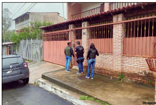
Justiça determinou busca de veículos e em residências, além de prisões