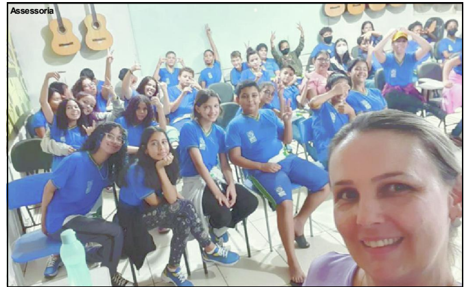
Programa Saúde nas escolas desenvolvido pelo Departamento de Atenção Básica

mês de outubro/2022, o programa desenvolveu ações nas instituições: Escola Estadual Marins Fátima Sá Teixeira, Escola Estadual Jayme Veríssimo de Campos (JVC), Escola Municipal Jardim das Flores e na APAE/AF - Associação de Pais e Amigos dos Excepcionais, tendo aplicado 18 palestras, abrangendo 48 turmas de estudantes e professores, totalizando um público entorno de 1.450 pessoas contempladas pelos trabalhos, que abordaram os seguintes temas: tabagismo, alcoolismo, entre outras drogas, COVID – 19, Monkeypox, câncer de mama e câncer do colo do útero.