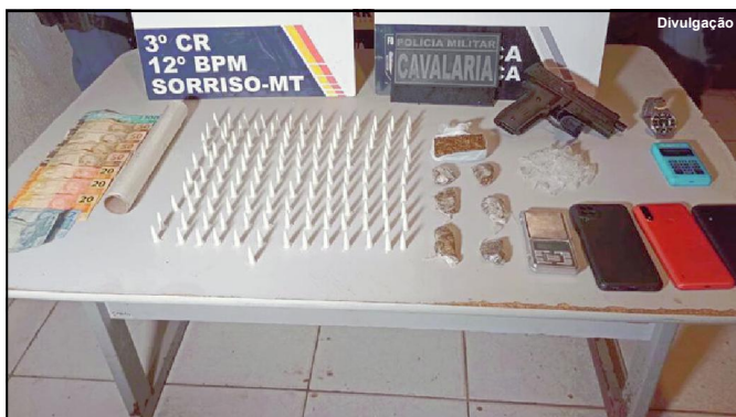
Todo o material foi encaminhado à Polícia Civil

Na ação realizada no bairro Primavera, três suspeitos foram presos