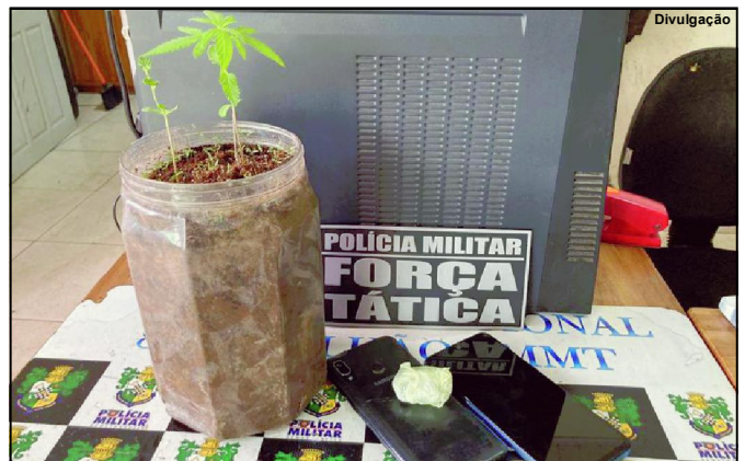
Muda de entorpecente foi apreendida pela Força Tática

Suspeito tentou dispersar também porção de entorpecente, mas policial viu