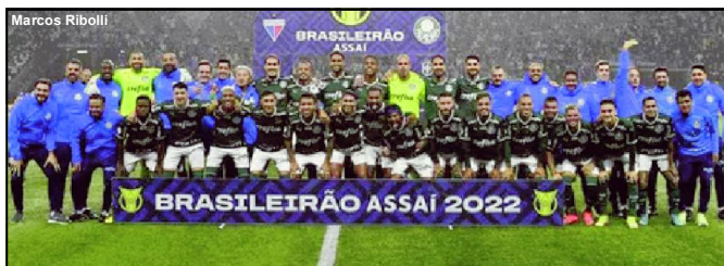
Palmeiras campeão brasileiro de 2022