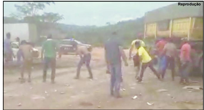
Manifestantes confrontando a PRF em Novo Progresso

“Intervenção militar significa rasgar a Constituição. Significa cancelar as eleições e tomar o poder, tomar pela força das armas, não pela força dos votos. Eu, particularmente sou contra isso”, completou.