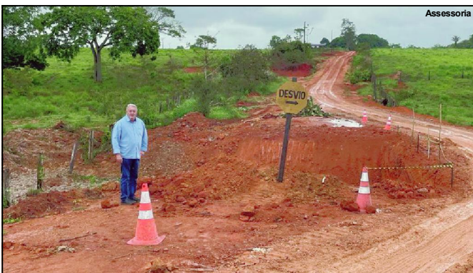
Vereador presidente da Câmara acompanhando mais uma obra em AF