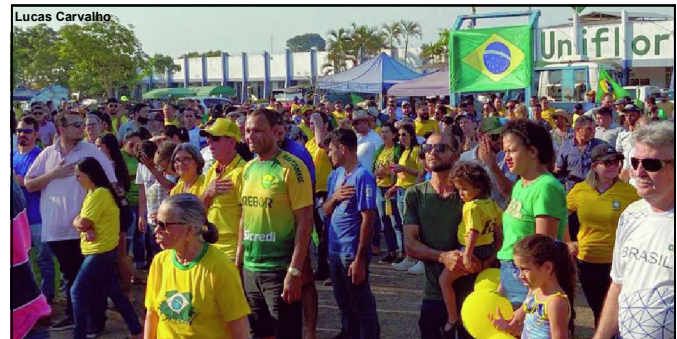
Empresas fecharam e colaboradores foram manifestar em Alta Floresta

Semana começou com manifesto ainda mais intenso na frente de unidade do Exército