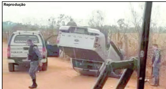
Caminhonete roubada por bando capotou e a PM chegou em seguida

Indivíduos capotaram carro roubado, foram para mata e acabaram cercados