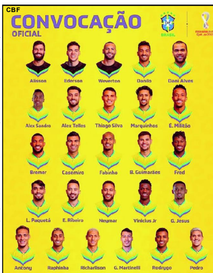
Seleção Brasileira convocada para a Copa do Mundo

A Copa do Mundo 2022 será disputada entre os dias 20 de novembro e 18 de