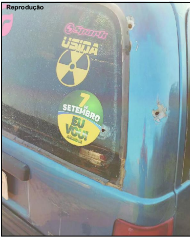
Carro usado por bandidos em crimes praticados em Alta Floresta

O caso é apurado pela Polícia Civil que ainda não conseguiu pistas dos meliantes, mas acredita que o carro será ponto fundamental para a identificação e prisão de todos.