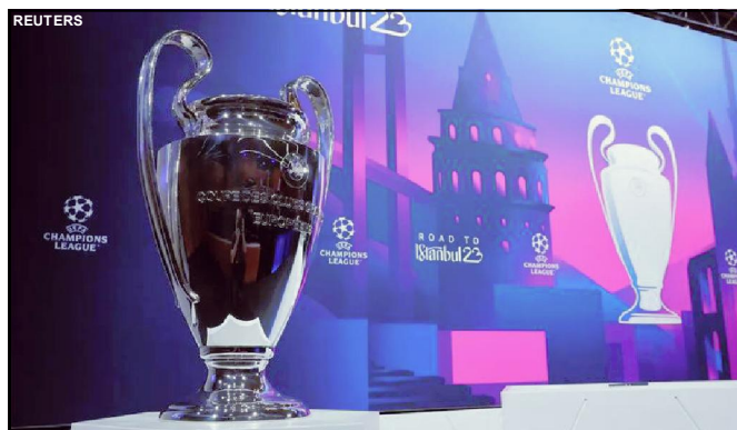
Troféu da Liga dos Campeões em exibição no sorteio das oitavas