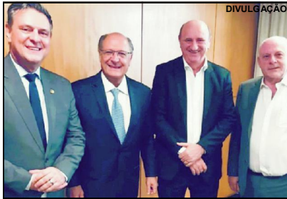
O senador Carlos Fávoro e o deputado Neri Geller já se reuniram com o vice-presidente eleito Geraldo Alckmin

O primeiro trabalho do grupo será a busca de contato com representantes de diversos setores da agricultura