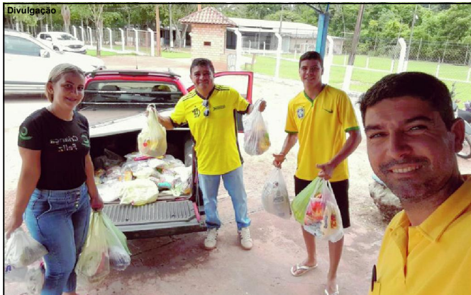
Presidente do Lions e outros voluntários felizes com resultado da campanha

Clube de Serviço arrecadou toneladas de alimentos com Campanha Natal Solidário