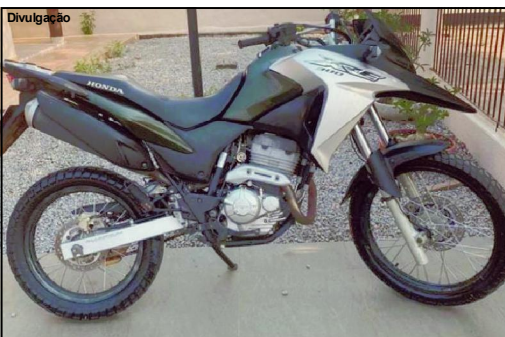
XRE foi furtada durante a madrugada no Setor RI

Alta Floresta/MT – Uma moto XRE-300, cor verde, prefixo QCM 4D17. Essas são características do veículo furtado da Rua H-9, Setor RI, município de Alta Floresta. O crime teria sido praticado durante a madrugada. Um