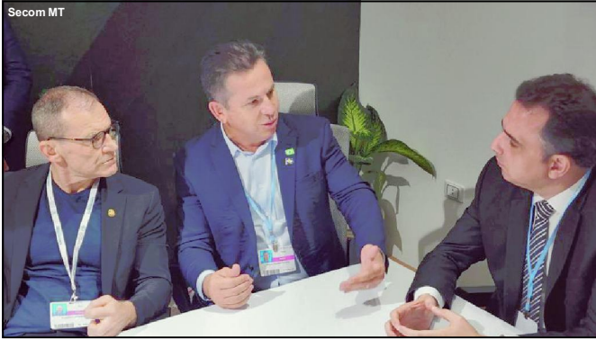
Discurso do governador já repercutiu de várias formas no setor produtivo

Mauro Mendes defende necessidade de endurecer punição para coibir a prática