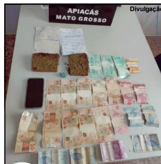
Droga foi apreendida com procurado da Justiça