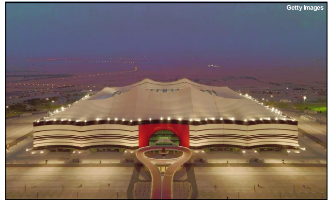
Estádio Al Bayt, casa da abertura da Copa

meio dia pelo horário oficial de Brasília.