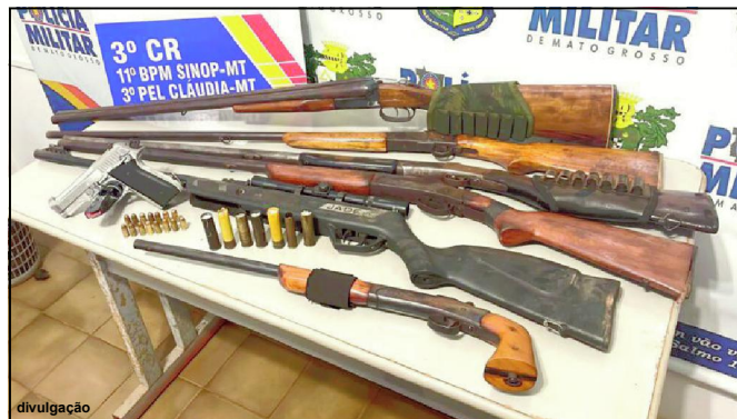
Armadamento apreendido pela PM na cidade de Cláudia

e 15 munições calibre 380 e sete munições calibre 32.