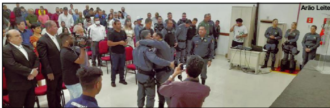
Cerimônia de posse do novo comandante da PM em Alta Floresta

Evento no auditório do IFMT marcado pela presença da cúpula da PM de MT