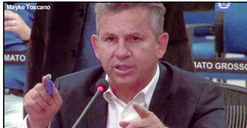
Governador volta a pautar meio ambiente em seu pronunciamento

O governador Mauro Mendes voltou a defender o confisco e perda de bens para quem praticar o desmatamento ilegal no país, principalmente, em Mato Grosso. Para ele, a pequena parcela que comete crimes ambientais está causando prejuízos, não apenas ao meio ambiente, mas à imagem do Brasil, do Estado, do agronegócio e à população. “Sempre fui contra o desmatamento ilegal. Quem pratica esse crime em Mato Grosso representa menos de 1% dos produtores. Ou seja, 99% das pessoas fazem de forma correta. Então, se 99% faz a coisa correta, olha o prejuízo que esse 1% está nos dando à imagem do Brasil, de Mato Grosso, do agro, olha o dano ambiental. Dinheiro de todos nós mato-grossenses que estamos gastando para combater uma ilegalidade e não está resolvendo”, afirmou.