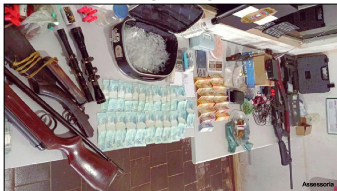
Material apreendido pela Polícia Civil em Itaúba