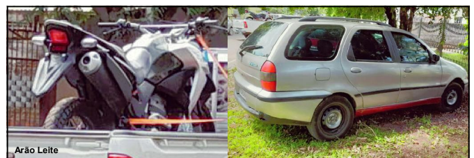
Motocicleta e carro foram apresentados junto à Polícia Civil

Proprietários procuraram delegacia para dar baixa em queixa