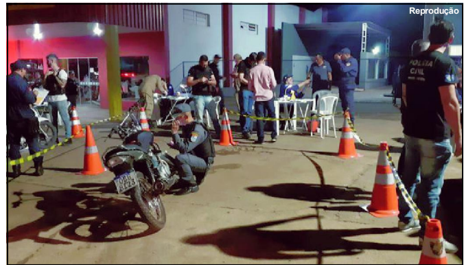
Agentes da Segurança Pública durante Operação Lei Seca em AF

Segundo o boletim de ocorrência da Polícia Militar, os suspeitos teriam fugido para uma estrada vicinal, entretanto, ninguém foi localizado. A delegacia de Polícia Civil de Lucas do Rio Verde conduz a investigação.