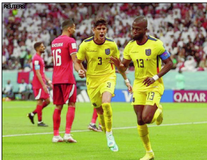
Equador venceu o Catar na abertura da Copa do Mundo