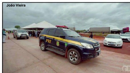
PRF monitora manifestos em rodovias federais de Mato Grosso

se denuncia diretamente sobre as ações tomadas e planejamento para conter os protestantes. Nesse período, a PRF foi criticada por não tomar uma medida mais incisiva para conter os protestantes. As forças de segurança monitoravam as ações.