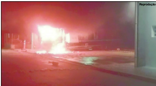
Destruição praticada no final de semana em Lucas do Rio Verde

Só Notícias/Ana Dhein com Kelvin Ramirez