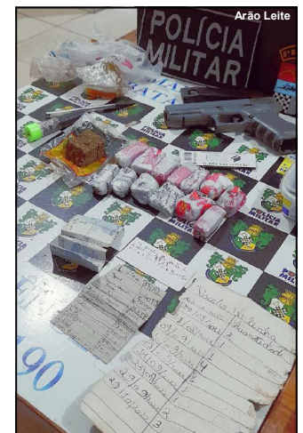
Droga apreendida e material do tráfico

O caso foi encaminhado para investigação da Polícia Civil.