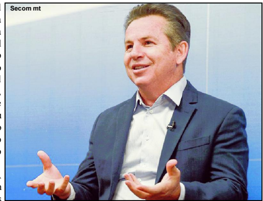
Governador Mauro Mendes, que vai escolher um nome de lista tríplice

algumas circunstâncias ostensivas em operações integradas, a Polícia Civil responde pelo combate aos crimes cibernéticos cometidos por cibercriminosos ou hackers que querem ganhar dinheiro. Agentes da corporação admitem que enxugam gelo no enfrentamento dessa