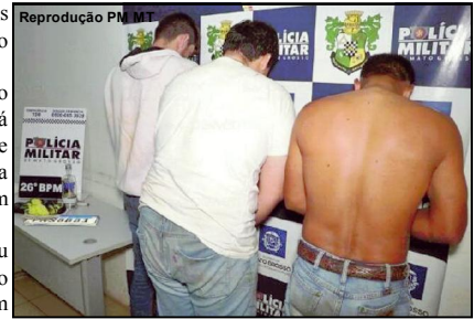
Trio foi preso após crime cometido em MT