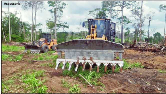
Maquinário apreendido na região de Juara