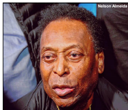
Pelé segue internado sem previsão de alta