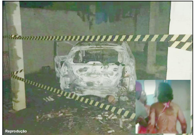
Incêndio deixou rastro de destruição e vítimas gravemente feridas

A irmã da mulher que tentava intervir acabou tendo o corpo queimado. “Teve