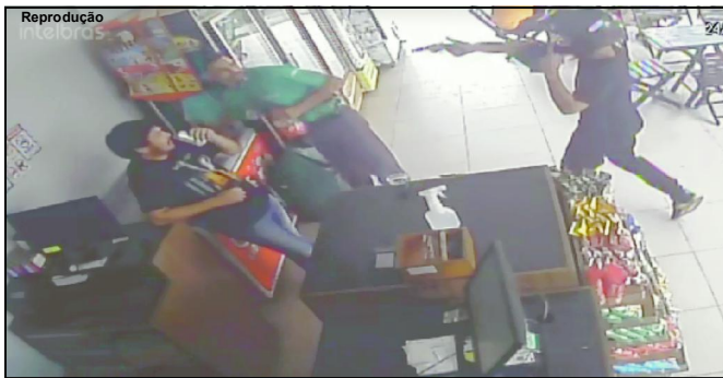
Momento em que ladrão chega apontando arma para vítimas

Bandido usava revólver cromado na ação criminosa em Alta Floresta