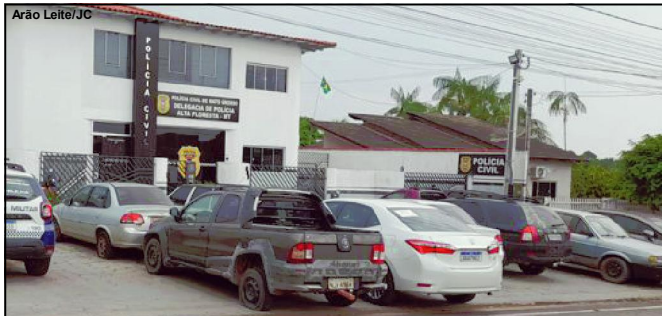
Infrator foi levado à Delegacia de Alta Floresta