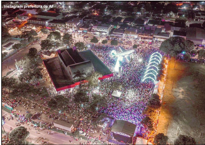
Praça da Cultura em Alta Floresta ficou lotada

Mesmo diante de chuva, o público comemorou a chegada de 2023