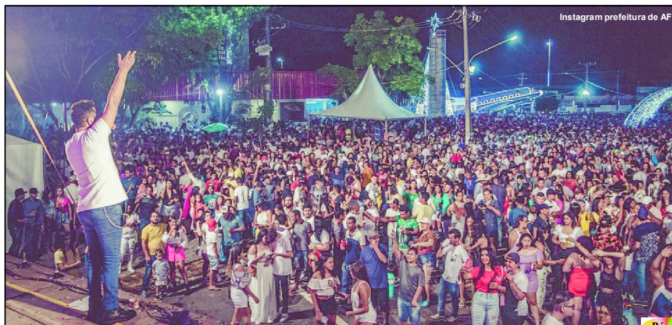
Instagram prefeitura de AF

Mesmo diante de chuva, o público comemorou a chegada de 2023