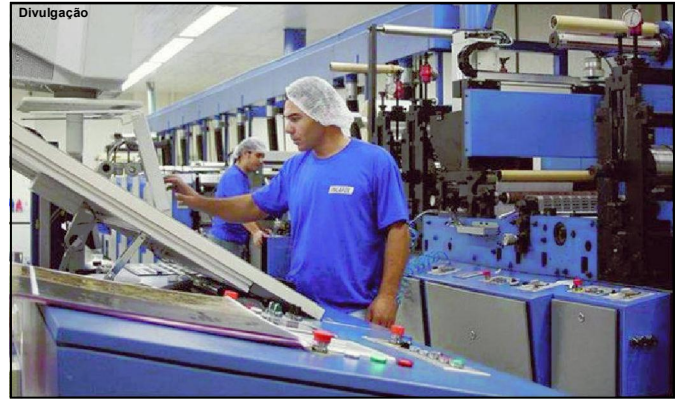
Mato Grosso é o Estado com a maior retração na atividade industrial

O Brasil conta atualmente com cerca de 20 milhões de empresas ativas