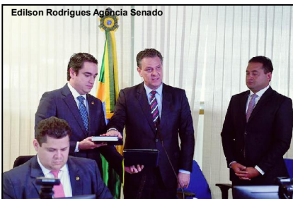
Fávaro que foi empossado senador em 2020, agora é ministro da agricultura