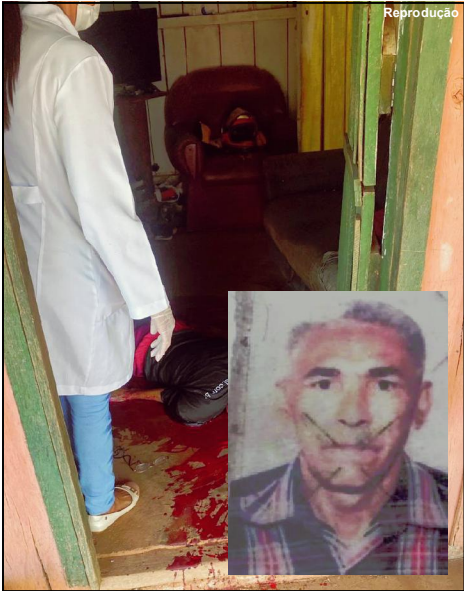
Crime em Nova Bandeirantes aconteceu no Bairro Primavera