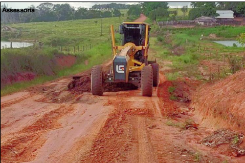
Máquina fazendo recuperação de ponto na rodovia estadual que corta Alta Floresta