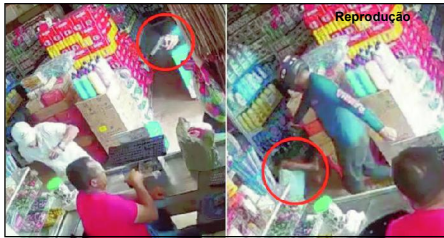
Assassino invadiu mercado e matou vítima na frente de várias testemunhas