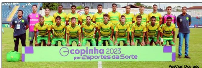
Cuiabá está na segunda fase da Copinha