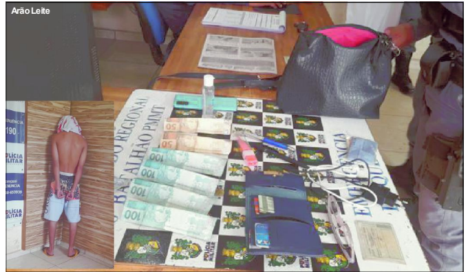
Menor foi detido e boa parte dos produtos recuperada pela PM

Mas a mulher, ao saber da informação que o autor detido é adolescente ficou indignada, tendo conhecimento que a punição pode ser branda devido ao fato de ser um menor “que roubou para tomar uma cervejinha”, só essas palavras para um bom