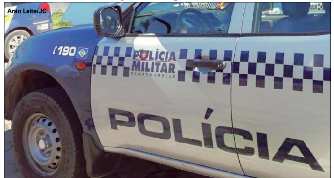
Polícia Militar recuperou caminhonete na tarde de ontem

Caso em Alta Floresta foi registrado pela Polícia Militar e encaminhado à Delegacia Municipal de Polícia Judiciária Civil