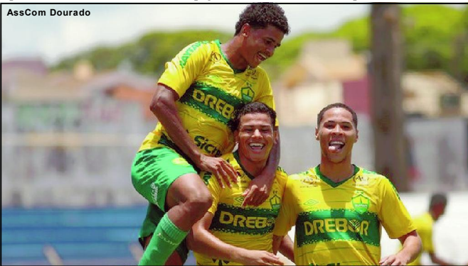
Cuiabá avança na Copinha

Encerrando a primeira rodada, Operário de Várzea Grande e Dom Bosco, no estádio Dito Souza, em Várzea Grande, às 17 horas.