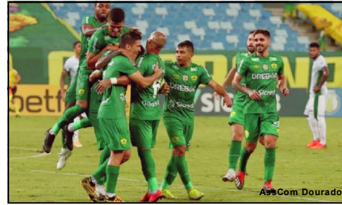
Cuiabá vai em busca do tricampeonato estadual consecutivo

Ainda no sábado, um clássico mais recente marca a primeira rodada. O União de Rondonópolis enfrenta o Academia, no estádio Luthero Lopes, às 18 horas. O Colorado tenta pelo segundo ano