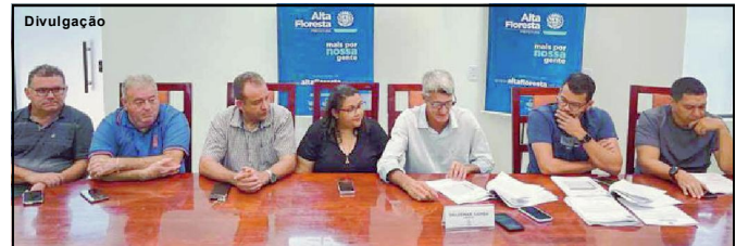
Lei complementar foi assinada essa semana pelo chefe do executivo