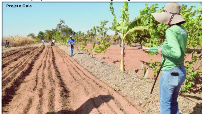
Projeto está atendendo muitos produtores em Mato Grosso

vidades de pesquisa e somando com a agroecologia.