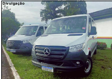
Veículos adquiridos pela administração municipal de Alta Floresta