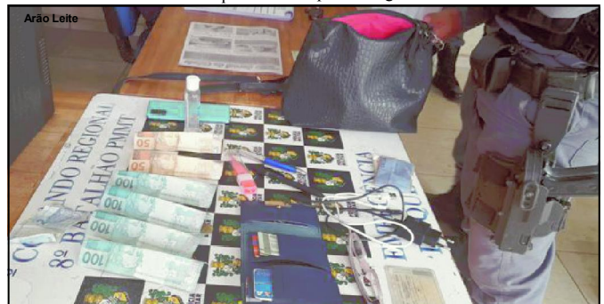
Policiais militares, que já tinham apreendido um suspeito chegaram até o segundo elemento que é também menor

Só que o suspeito avançou para cima da vítima, pegou uma faca e disse que a mataria se ela ligasse para a polícia. Porém, a mulher reagiu e ligou para a PM que chegou lá, mas o suspeito tinha foragido pela parte dos fundos do quintal. O caso foi encaminhado à Polícia Civil.