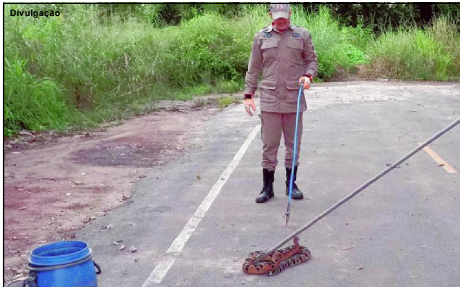
Serpente venenosa sendo capturada pelo Corpo de Bombeiros