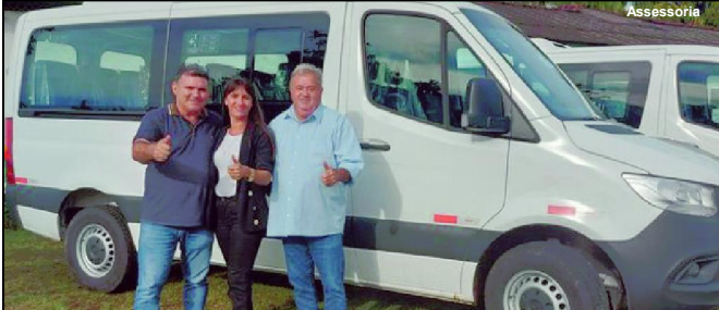
Entrega de veículos em Alta Floresta