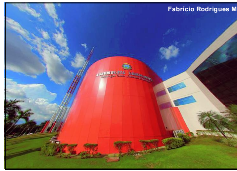
Matéria foi sancionada nesta segunda-feira, mas até 2025 terão outros três reajustes