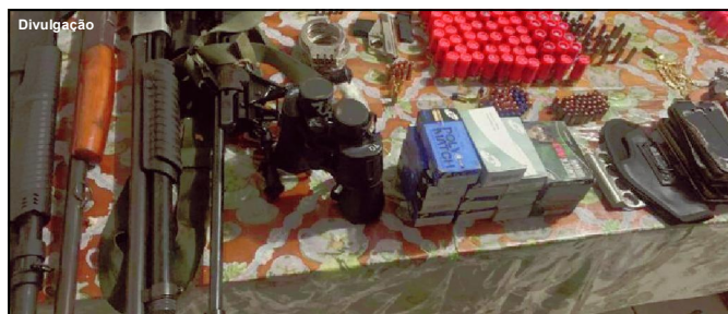
Arsenal apreendido na zona rural de Feliz Natal