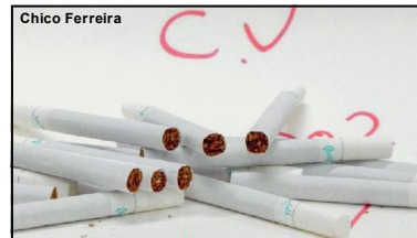
Organização criminosa se articula para comandar comercialização de cigarro contrabandeado