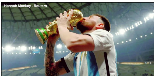
Messi com a taça da Copa do Mundo