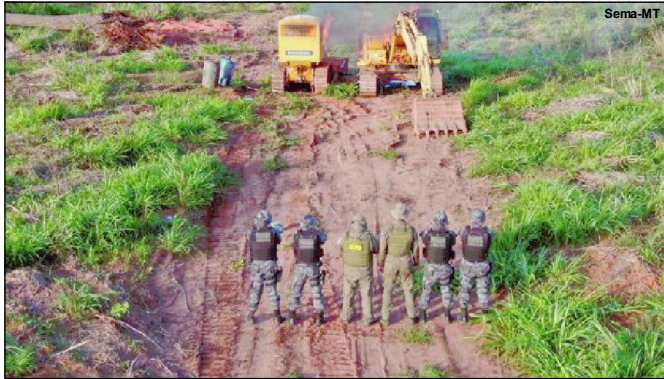
Operação apreende maquinários na região Norte

Nos últimos quatro anos, o investimento na prevenção e combate ao desmatamento ilegal e incêndios florestais chegou a R$ 180 milhões