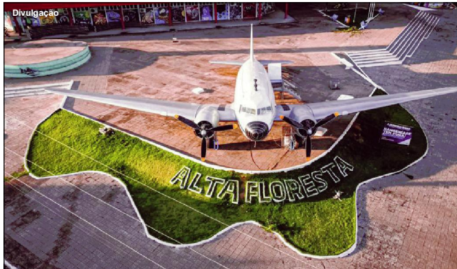
Aeronave patrimônio histórico é cartão postal do município