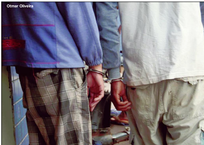
Infrator flagrado com outro suspeito tinha droga escondida na parte íntima