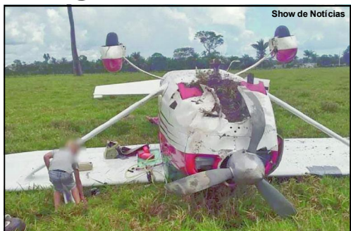
Aeronave ficou de pneus para cima quando caiu em comunidade de Juara