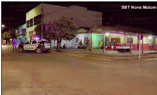
Execução é investigada pela Polícia Civil de Nova Mutum