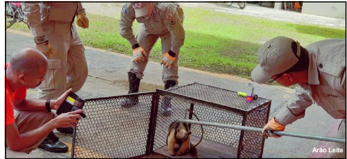
Animal foi encontrado no Setor G, região central do município

Tanto a Jiboia quanto a Pico-de-jaca foram levadas para uma área distante da região urbana e devolvidas à natureza.