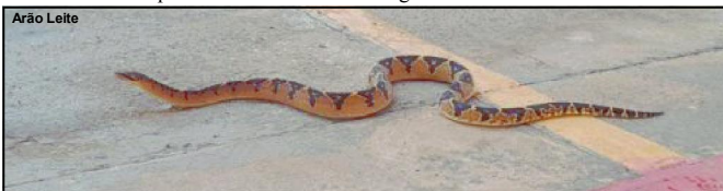
Cobra pico-de-jaca é peçonhenta e a picada pode ser letal

Quem se deparar com algum crime ambiental deve denunciar por meio dos telefones 0800 065 3838, WhatsApp (65) 9 9321-9997 ou comparecendo em uma das nove diretorias regionais ou sede da Sema em Cuiabá.