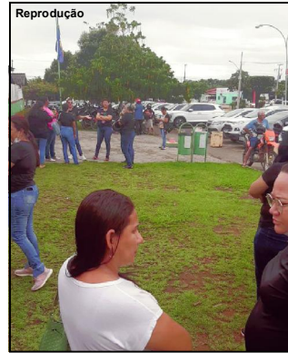
Movimentação de servidores começou cedo em frente à Prefeitura

A categoria que recebeu um reajuste no ano de 2022, continuou recebendo o salário antigo. Mas tinha conhecimento que o acréscimo já era liberado pelo governo desde o mês cinco do ano passado. Tanto que por algumas vezes o assunto foi parar na Câmara de Vereadores onde se chegou a um acordo de até o final