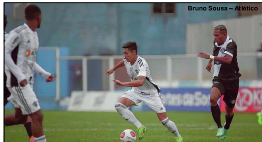
Mixto 1 x 2 Atlético Mineiro