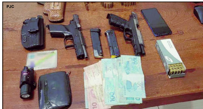
Duas pistolas apreendidas pela Polícia Civil com o suspeito

Em continuidade das diligências, os policiais da Delegacia de Nova Bandeirantes realizaram buscas pelo suspeito, que foi localizado na região central da cidade. Questionado sobre