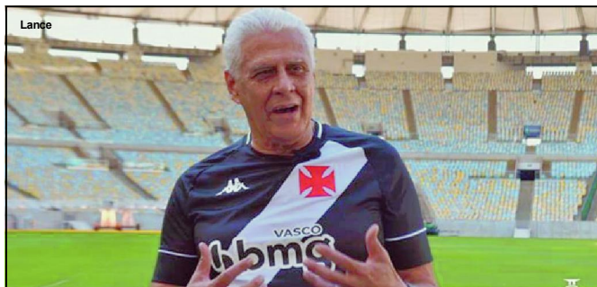
Roberto Dinamite esta eternizado na história do Vasco da Gama

Como presidente do Vasco, Dinamite dividiu opiniões mas sem deixar de ser ídolo. Foi campeão da Série B e do até então inédito título da Copa do Brasil, conviveu com o rebaixamento em 2013 e um ano depois deixou a presidência do clube ao final de seu segundo mandato. Roberto Dinamite pessoa, atleta ou dirigente, sempre fará parte da história contada do Vasco da Gama e do futebol brasileiro.